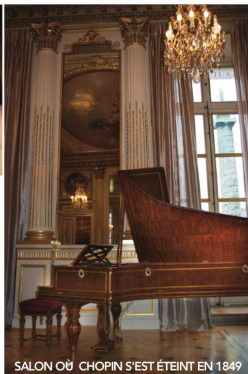
SALON OÙ CHOPIN S'EST ÉTEINT EN 1849